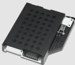
Zweiter Akku 10.8V, 8700mAh