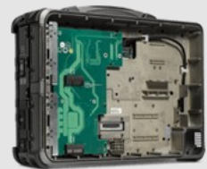
PCI oder PCI-Express-3.0- Erweiterungsgerät