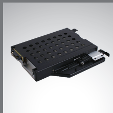
Multimedia-Einschub 2. Speicher